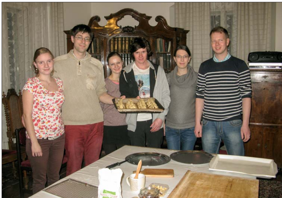
Novomanželská vánočka aneb Setkání mladých manželských párů 4. 12. na faře ve Vizovicích. Povídalo se při punči o přípravách na první společné Vánoce a všichni si zkusili upéct první skutečnou manželskou vánočku.