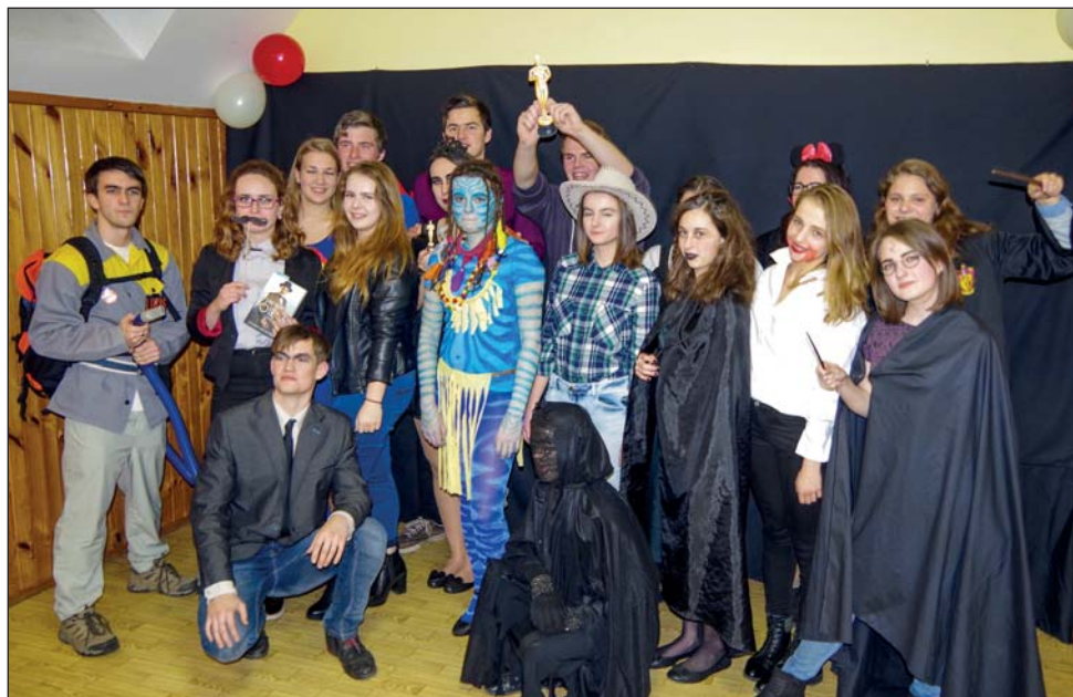
Farní Silvestr se tentokrát nesl ve filmovém duchu. Děkujeme všem, kteří podléli na jeho organizaci.“