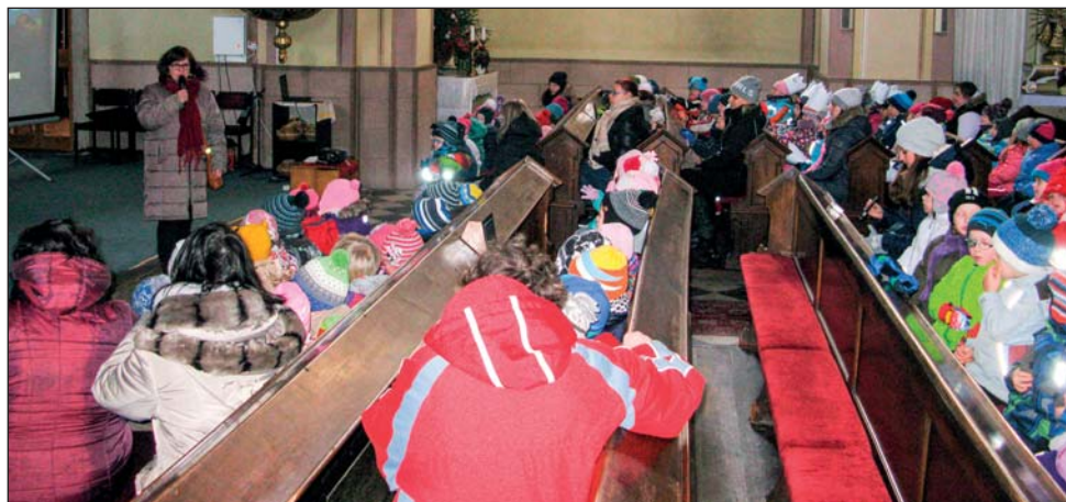
Děti ze školy a školky přišly 6. ledna dopoledne do našeho kostela na Tříkrálové povídání.