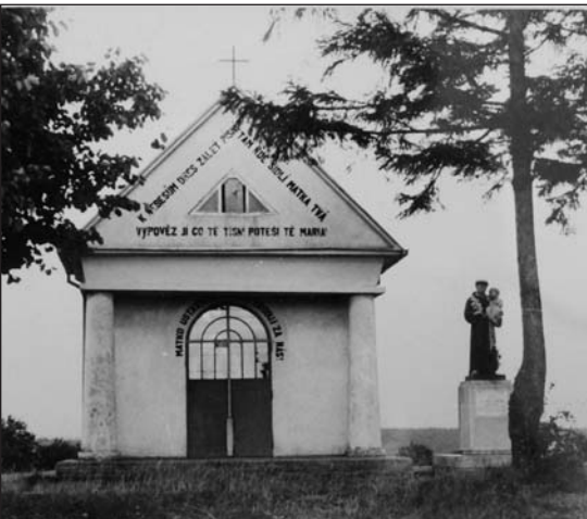
Kaplička se sochou z roku 1943

V listopadovém vydání Farního zpravodaje jste si mohli přečíst článek o kapličky na Příluku a prázdném podstavci, který vedle ní stojí. Kaplička a socha svatého Antonína Paduánského, která na podstavci v minulosti stála, byly vysvěceny současně v roce 1938.