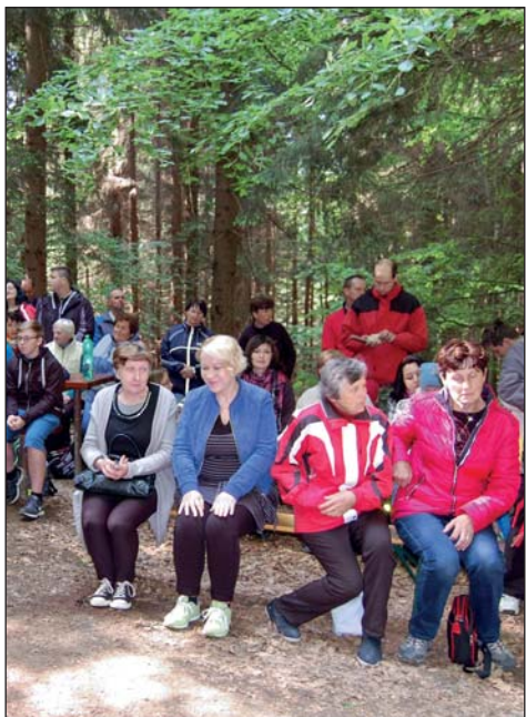
Pouť u Chladné studny 21. 5. 2017