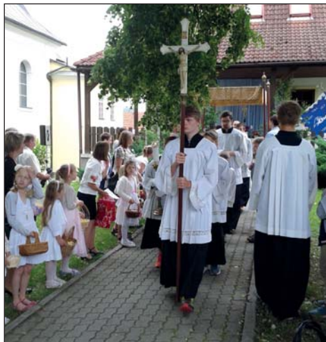
3. června - slavnost Těla a Krve Páně. Po mši svaté prošel městem eucharistický průvod.