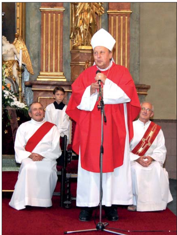
Tradiční poutní mši svatou k sv. Vavřinci v neděli 9. 8. slavil světitel biskup z Českých Budějovic Mons. Pavel Posád. Děkuji všem, kteří zajistili úklid a výzdobu kostela, liturgii, oběd pro kněze i posezení u orlovný.