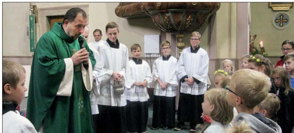
V neděli 27. 8. byly školákům posvěceny jejich aktovky.

V sobotu 9. září 2017 se ministranti naší farnosti zúčastnili Ministrantské pouťi v Uherském Brodě. Téma letošní pouti bylo Ministrant – misionář dneška. Po příjezdu jsme se rozdělili do skupinek, ve kterých jsme celý den soutěžili a plnili úkoly. Program začal mší svatou. Pak jsme procházeli jednotlivá stanoviště, kde na nás čekali hasiči, policisté, vojáci a záchranáři.