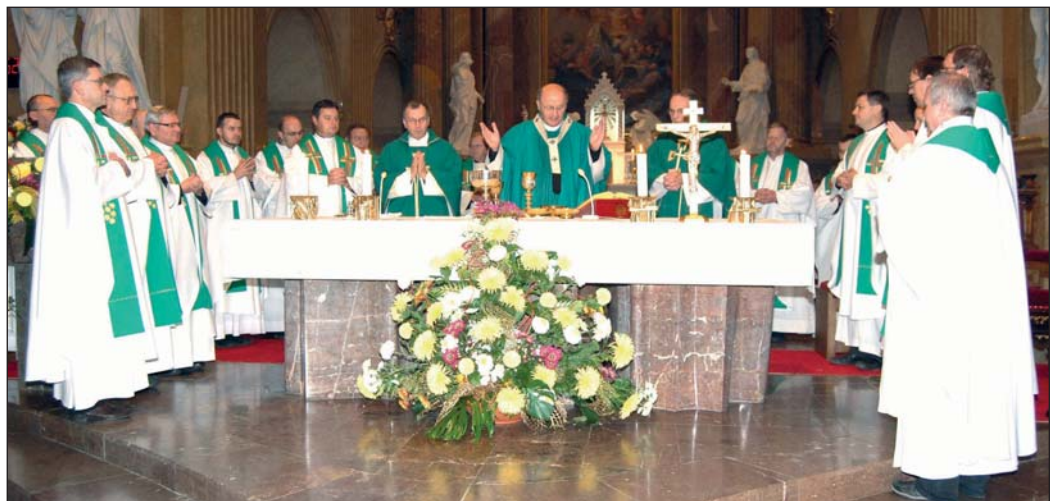
V sobotu 8. 11. se konala na Velehradě tradiční děkanátní pouť za obnovu rodin a za nová duchovní povolání. Ať tato pouť přinese hojný užitek také v podobě nových povolání z rodin naší farnosti.