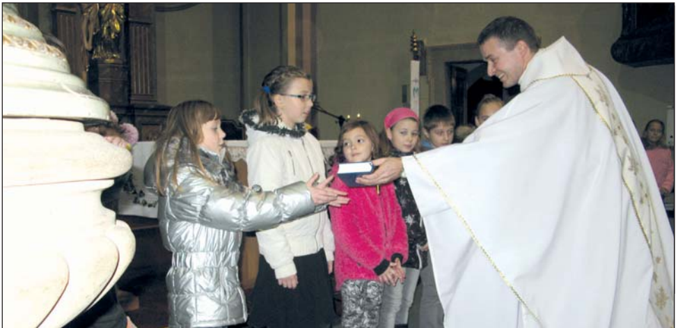
V pátek 21. 11. dostalo 19 dětí, které se připravují na první svaté přijímání, Kancionál. Snažme se jim dávat dobrý příklad v pozorné a aktivní účasti na mši svaté.