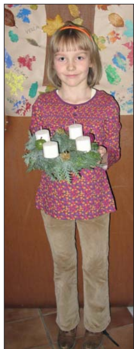
Řada dětí využila nabídku CPR Vizovice a přišla si ve čtvrtek 27. 11. na faru vyrobit svůj adventní věnec. Kež nejen jim zapálené svíčky připomínají, že si Bůh přeje, abychom žili jako děti světla.